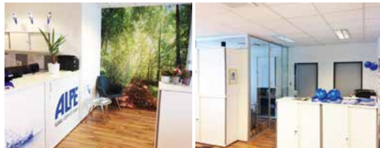
Der neue Standort in der Perfektastraße in Wien.

Auch die ALPE-Niederlassung in St. Pölten ist auf Expansion aus-